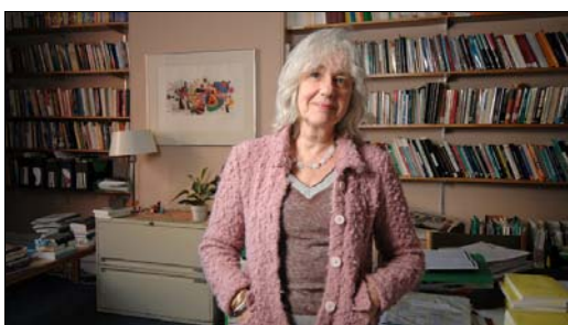
Marguerite Mendell lauréate du prix Acfas Pierre-Dansereau 2012

Chaque année, depuis 1944, l'Acfas s'associe à des partenaires pour décerner des prix récompensant des contributions exceptionnelles à la recherche scientifique. Les 13 prix Acfas soulignent des percées significatives dans tous les domaines de la recherche, et ils viennent aussi soutenir les chercheurs prometteurs de la relève. Ils sont destinés aux chercheurs travaillant dans le secteur public ou dans l'entreprise privée. Les lauréats-chercheurs et les lauréats-étudiants reçoivent une bourse de 5 000 $. Un comité d'évaluation est constitué pour chacun des prix. Ces comités sont formés de trois à cinq personnes.