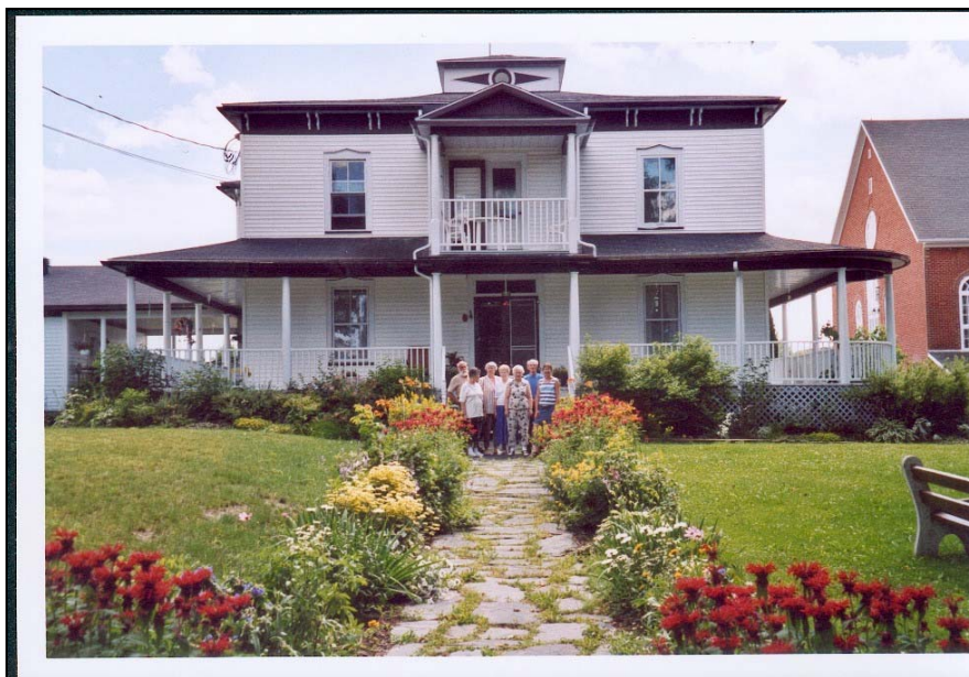
PHOTO 3 Quelques résidants devant la porte d'entrée de La Corvée, en compagnie de la coordonnatrice