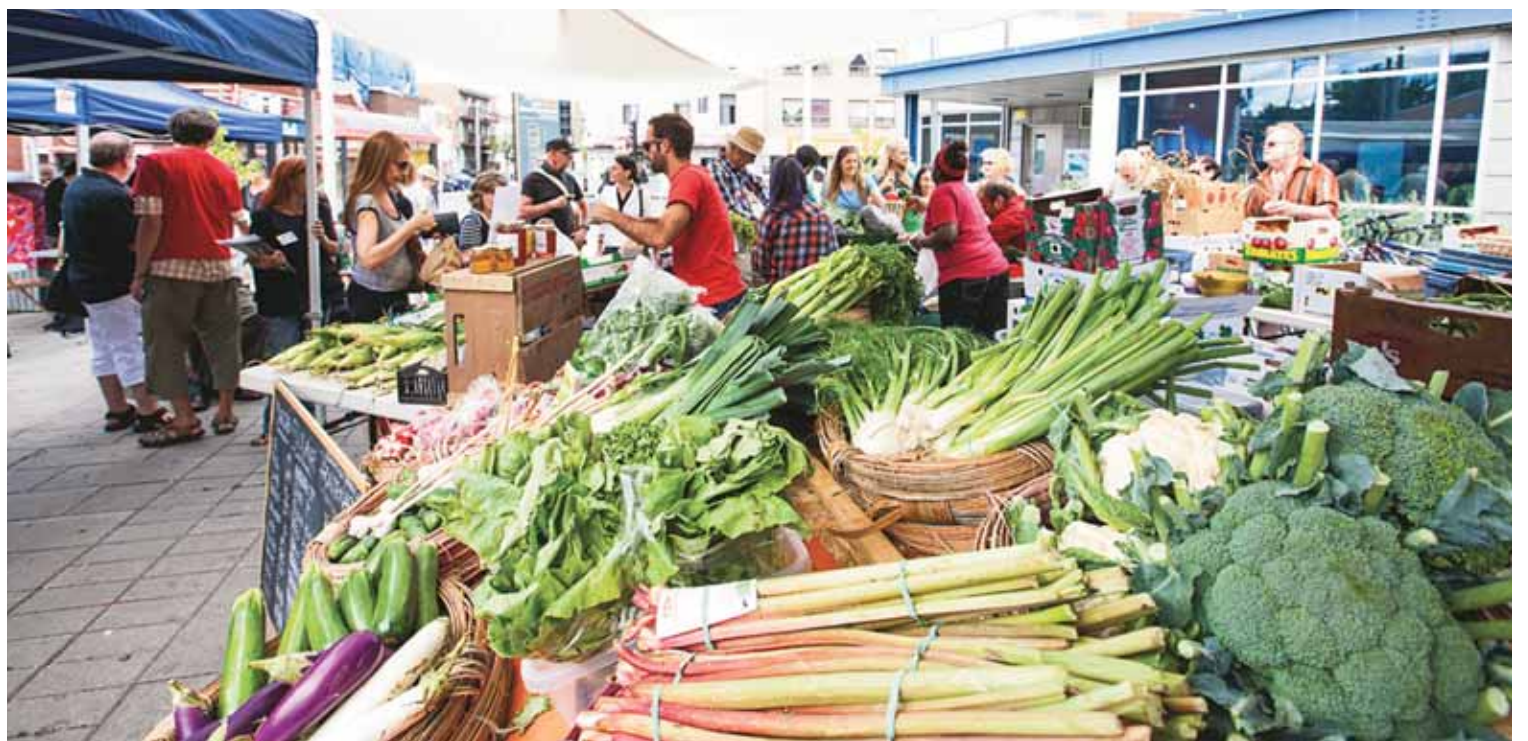
Le Marché solidaire de Frontenac veut offrir de 20 à 30% de rabais sur les produits vendus en échange de bénévolat.

«Le principal défi, c'est qu'on est obligés d'avoir des espaces