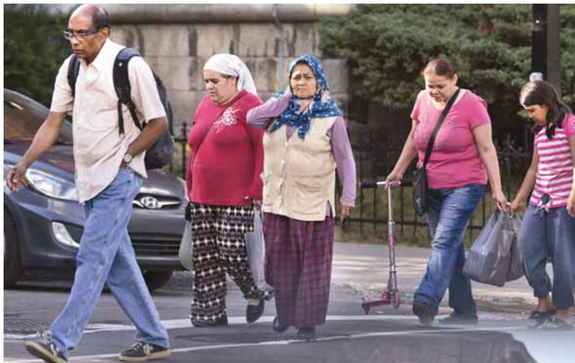
JACQUES NADEAU LE DEVOIR

Oui. Et ils ne réagissent pas non plus à ces attaques de la même façon. Par exemple, pour les Noirs-Américains et les Palestiniens vivant en Israël, le sentiment d'appartenance au groupe est très fort, mais ils n'ont pas nécessairement les mêmes réponses face à la stigmatisation. Les Palestiniens sont tellement discriminés qu'ils n'ont aucun espoir d'améliorer leur situation. Ils préfèrent ne pas tenir compte des incidents racistes auxquels ils font face. Les Noirs-Américains ont plutôt tendance à affronter. Par ailleurs, les Noirs au Brésil vivent les incidents racistes comme ayant à voir avec le fait qu'ils sont stéréotypés comme étant pauvres. Aux États-Unis, ils affirment clairement que c'est le fait qu'ils soient Noirs en tant que tels qui les stigmatise. Les Brésiliens mettent plus l'accent sur la couleur de la peau, alors que les Américains évoquent cette couleur, leur culture, mais aussi toute une histoire née de l'esclavage. Les groupes marginalisés ne se constituent pas tous de la même façon. Et il est