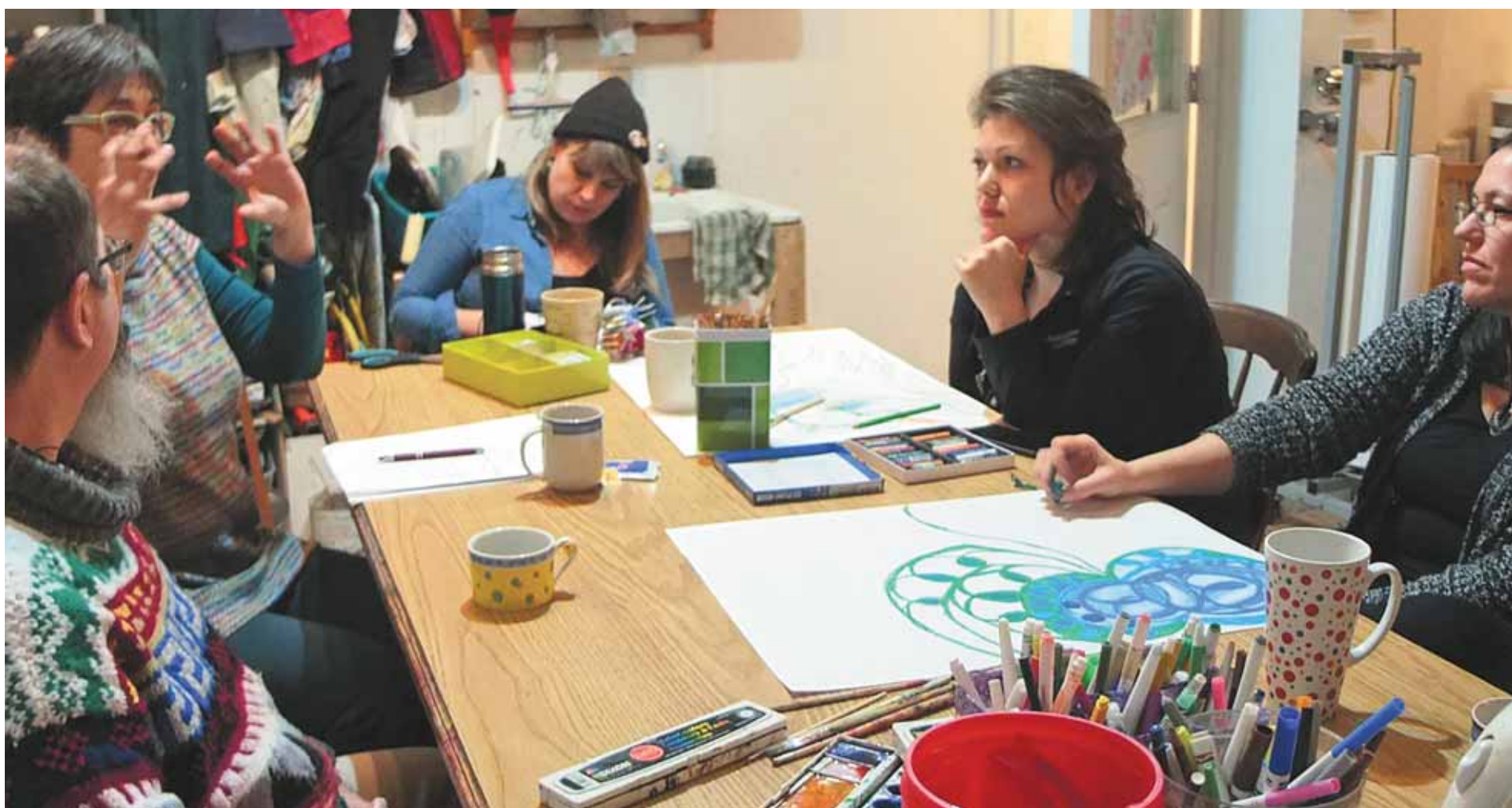
RUCHE D'ART SAINT-HENRI

Les ateliers scientifiques dans les ruches d'art ont commencé au Québec en 2015 à Saint-Henri. On y a parlé notamment de réactions chimiques, de sucre, de gravité et des stratégies de camouflage des animaux. Avant de commencer un atelier scientifique, les participants sont invités à la ruche d'art pour créer en s'inspirant du sujet du jour.