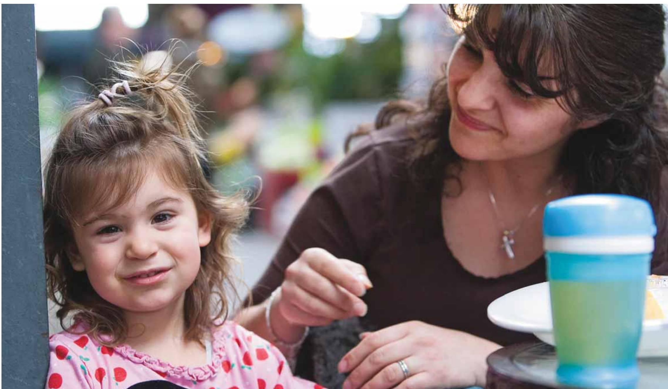
ANNIK MH DE CARUFEL LE DEVOIR

Dans les années 1970, les femmes ont eu besoin de faire garder leurs enfants puisqu'elles désiraient s'intégrer au marché du travail. Elles ont donc mis sur pied des garderies populaires qui se sont transformées progressivement en CPE. « On voit là l'évolution d'une idée sortie de la communauté pour être ensuite structurée et institutionnalisée », assure Simon Tremblay-Pépin.