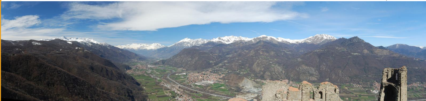
Panorama du Val de Suse depuis la Sacra di San Michele

Marina L.A. SOUBIROU Doctorante Enseignante UMR PACTE – LabEx ITEM Université Grenoble Alpes marina.soubirou@umrpacte.fr